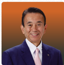
鈴木 康友 静岡県知事